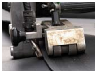
Die ABG-Dichtungsbahn wird mit ihren überlappt verlegten Nähten thermisch verschweißt

Die Firma ABG hat das ABG-Kellerdicht-System entwickelt, das dauerhaft und kostengünstig eine atmungsaktive Kellerabdichtung sicherstellt. Das System ist keine neue Erfindung, denn die Abdichtungstechnik (Schweiß- und Prüfverfahren) ist bereits seit Jahrzehnten erfolgreich im Tankstellen- und Deponiebau im Einsatz und verhindert dort, dass Kraftstoffe oder giftige Substanzen in den Boden gelangen. Produkte, die den strengen Industrienormen und TÜV-Prüfungen standhalten, übertreffen die Vorgaben im Privatbau allemal.